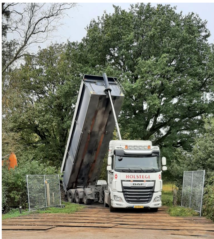
De eerste vrachtwagens voeren het leemhoudend zand aan vanuit Wolvega. Op de kruising Beerzerhooiweg–Mariënbergdijk is een depot ingericht.