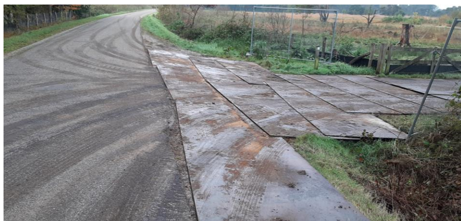
Bij beide ingangen van de depots zijn rijplaten gelegd om insporing en schade aan de wegrand te voorkomen.