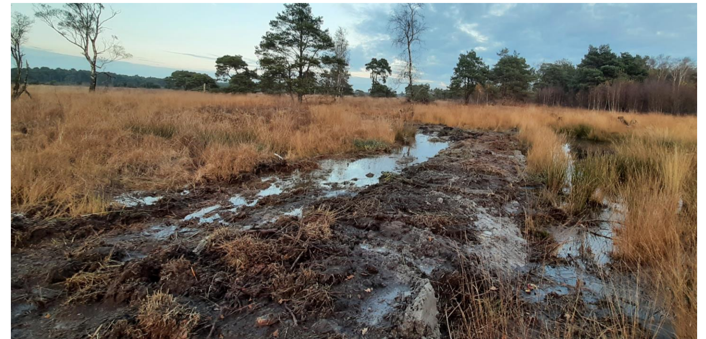
Het leemhoudend zand brengen we aan op de juiste NAP-hoogte (zichtbaar in de kraan). Vervolgens afgewerkt met de vooraf ontgraven zode, zie hier kade K-14. In drie dagen tijd is er al een hoogteverschil in het waterpeil te zien (links is hoger).