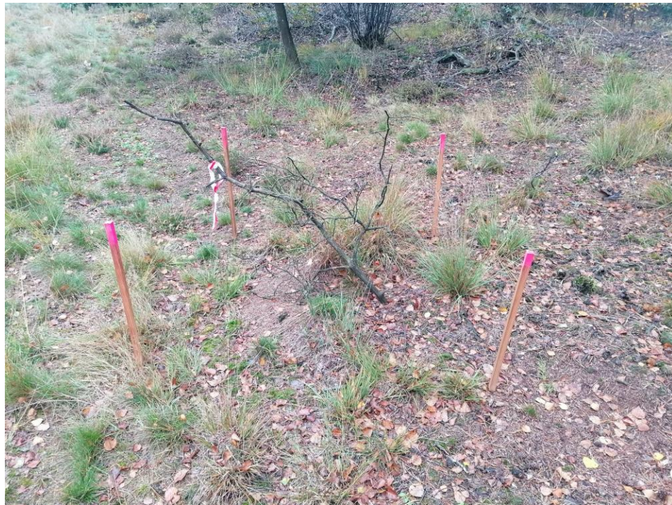
Ecologisch waardevolle elementen als bijvoorbeeld mierennesten hebben we vooraf gemarkeerd.