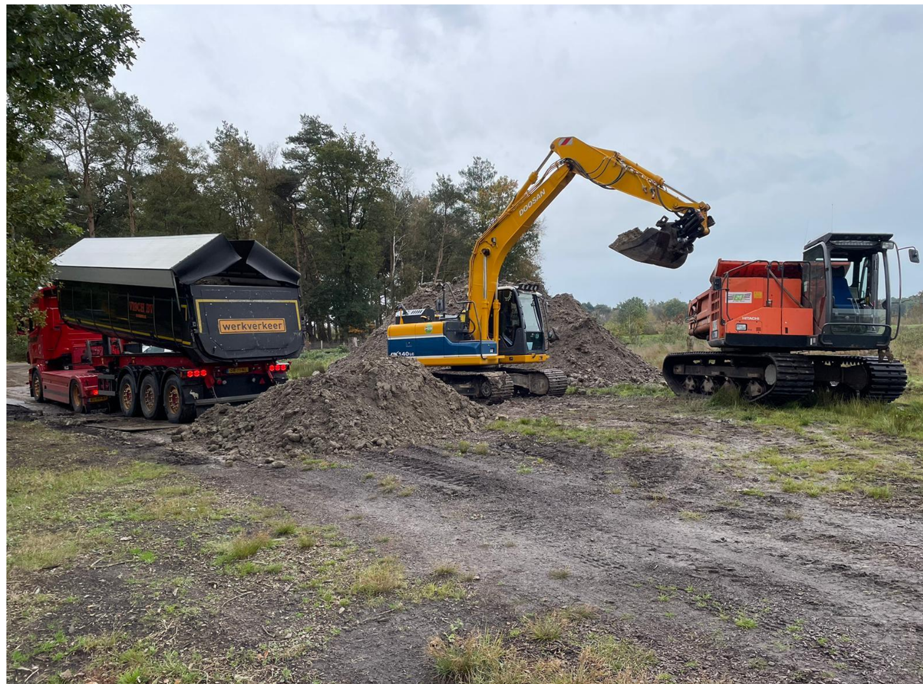
Het tweede depot wordt aan de Beerzerhooiweg–Vennedijk ingericht.