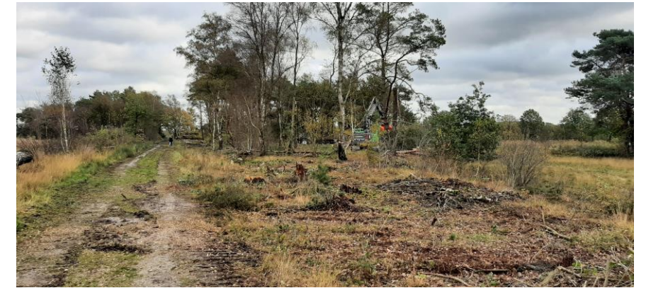
Tussenbeeld boskap deelgebied 2 met aan de linkerkant de Mariënbergdijk.