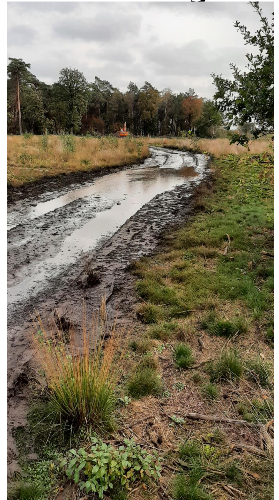
Ondertussen wordt het in Beerze steeds natter. Zie hier de Vennedijk.