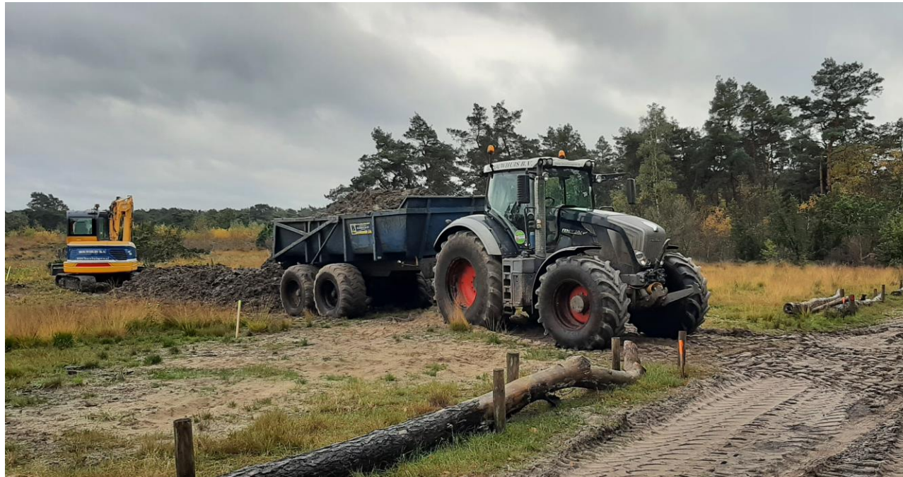
Een trekker en dumper brengen het leemhoudend zand vanuit de depots naar de tussendepots, zoals hier aan de Gemoelaksweg.