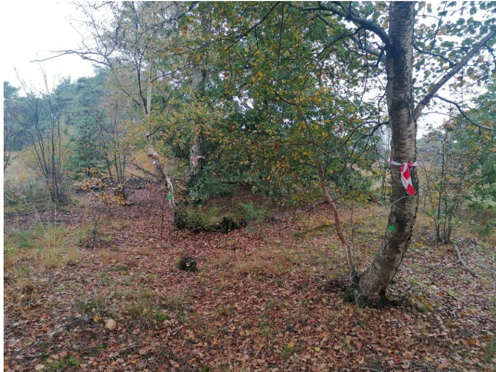
De te behouden bomen zijn gemarkeerd met rood-wit lint.