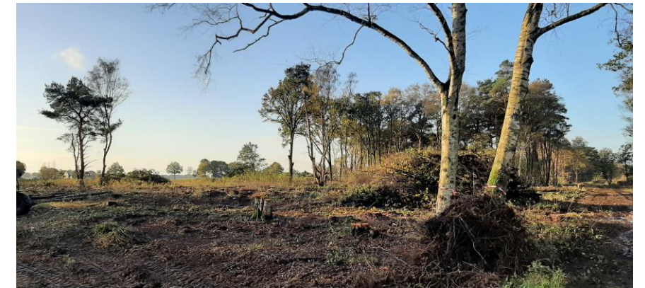
Tussenbeeld boskap deelgebied 2, met aan de rechterkant de Mariënbergdijk.