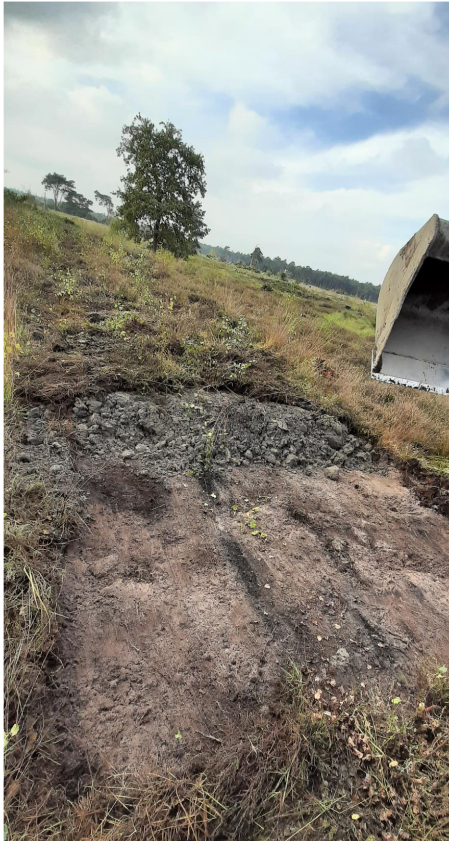
Dwarsdoorsnede tijdens het aanbrengen van kade K-9. Doel van de kades is het regenwater langer vast houden in het gebied (hoogveen).