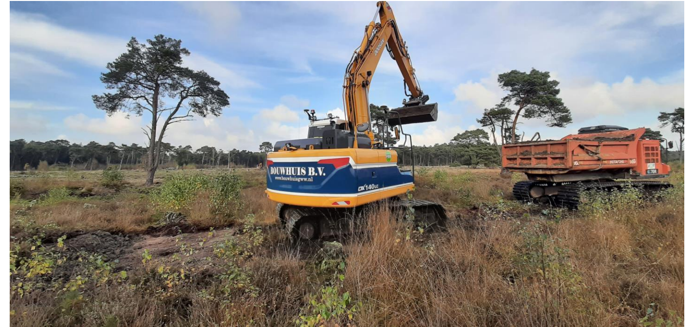
Vervolgens verwerkt de mobiele kraan op rupsen het leemhoudend zand in de kades en greppel. Zie hier kade K-9.