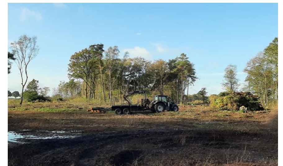
Het tak- en stamhout wordt eruit gered. Aan de rechterkant loopt de Mariënbergdijk.