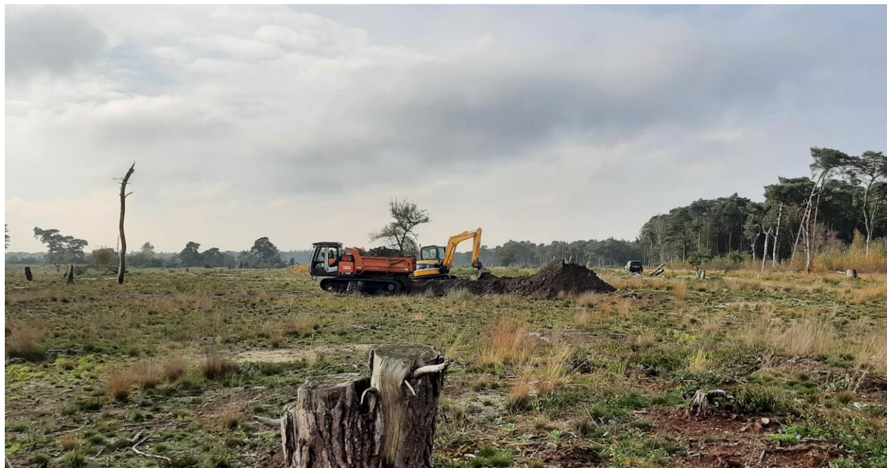
Vanuit het tussedepot laden we het leemhoudend zand op kantelbare rupsdumpers. Hierdoor beperken we de insporing zoveel mogelijk. Aan de rechterkant loopt de Vennedijk.