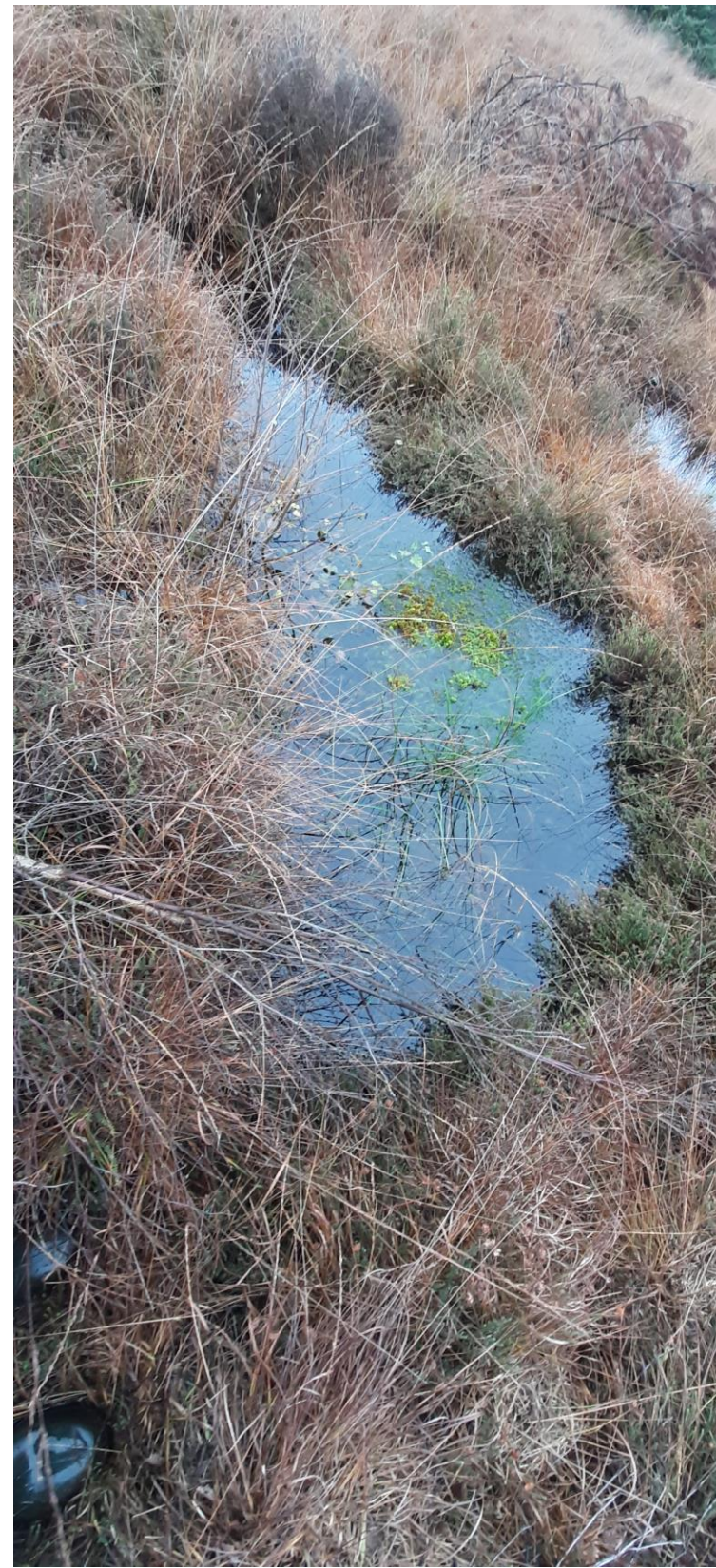
Tijdens het veldbezoek kwamen we in de veenputten P-4 en P-5 Blaasjeskruid tegen, een waardevolle soort dat gespaard blijft.