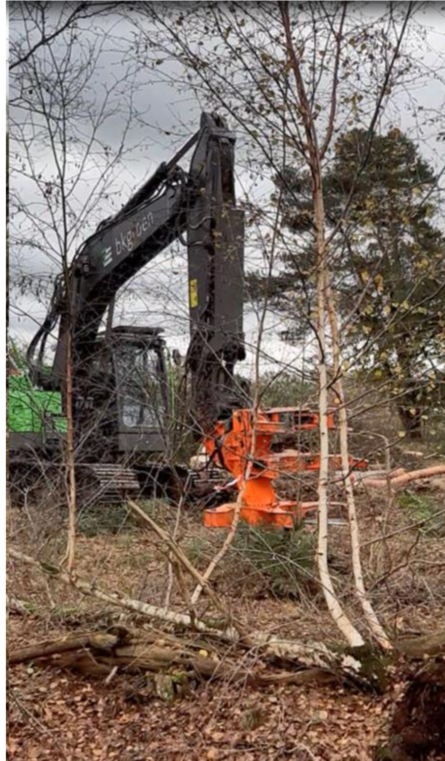
Met behulp van een mobiele kraan op rupsen wordt het bos eraf geknipt.