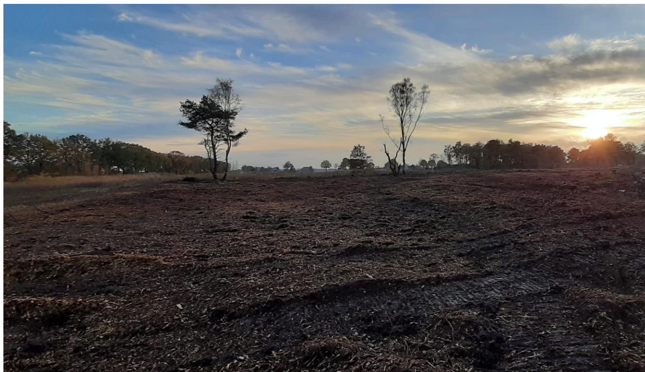
Het eindbeeld na de boskap en de te frezen stobben, gezien vanaf de Mariënbergdijk.