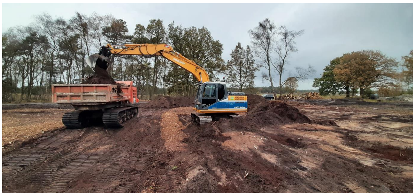
Start van de plagwerkzaamheden voor een open terrein met heide.